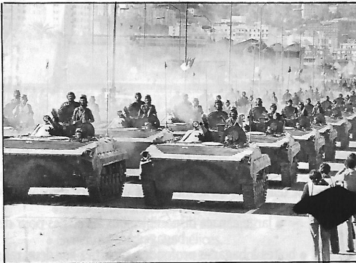
Véhicules de combat d'infanterie BMP-1 de fabrication soviétique en service dans les forces armées algériennes. Ces engins sont dotés d'un missile antichar Sagger et d'un canon de 73 mm

Le 25 mars, Radio Tripoli a consacré toutes ses émissions de la nuit à diffuser des appels à la nation arabe l'invitant au soulèvement contre l'hégémonie américaine estimant qu'un premier résultat de la stupidité des Etats-Unis était la perte de trois de ses avions, abattus, selon elle, par la défense aérienne. Reprenant sans modifications les bulletins annonçant en début de soirée la destruction par l'aviation de trois appareils américains, la radio a diffusé à longueur de nuit chants guerriers, discours du colonel Kadhafi faisant le procès du président américain Ronald Reagan et appels au soulèvement du peuple arabe. Selon le bulletin annonçant la "destruction par la défense aérienne libyenne de trois avions américains qui se sont abîmés en mer", cet incident a