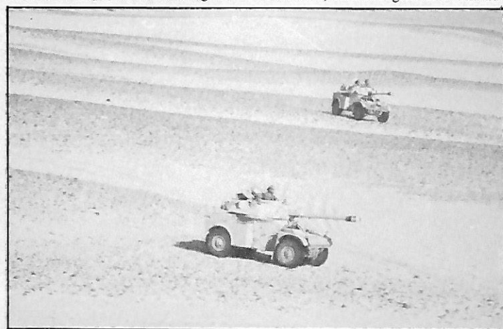
Automitrailleuses AML-90 Panhard (France) des FAR évoluant en région désertique

Mohamed, a assisté dans l'après-midi à des manoeuvres militaires au Sud de Boudnib, dans le Sud-Est, à environ 25 km de la frontière algérienne, à la hauteur de Colomb-Béchar. Le prince a rappelé aux unités qu'il visitait "l'importance stratégique de cette région". Cette visite, a-t-il dit, s'inscrit dans le cadre de la tournée qu'effectue actuellement le roi Hassan II dans certaines provinces du Sud du pays. Les unités visitées par le prince héritier étaient constituées du deuxième groupe d'engins blindés des FAR et du cinquième régiment d'infanterie mécanisée. La frontière maroco-algérienne, dans cette zone, reste encore théorique dans la mesure où elle n'a toujours pas fait l'objet d'un accord entre Rabat et Alger. Les cartes géographiques marocaines ne mentionnent aucun tracé frontalier précis entre les deux pays dans cette région.