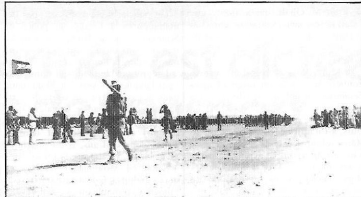
Forces du front Polisario défilant

Selon ce communiqué, ces opérations de harcèlement des positions marocaines ont duré plusieurs heures et ont eu lieu à Llagued, Taref Bouhenda, Nord d'Amoyguiz, Touajil, dans la région de Moytirat, entre El Ouj et Grayer, et entre Dakhlet Esbat et Taref El Moukhna.