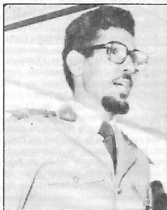
Lieutenant-colonel Ould Haidallah

servira jamais de bases d'attaques » contre les forces marocaines. Pour témoigner de sa bonne foi, le lieutenant-colonel Ould Haidalla a fait état des missions d'observateurs qui ont pu de nombreuses fois constater sur place que le territoire mauritanien était bien contrôlé par l'armée et non par le front Polisario. 10 jours seulement avant les attaques des forces du front contre Dakhla qui, selon le roi du Maroc, seraient venues de Mauritanie, des journalistes et des attachés militaires accrédités à Nouakchott avaient pu visiter la base de Bir Moghrein et ses environs, dans l'extrême Nord du pays, à proximité des frontières du Sahara occidental, sans y trouver trace de la présence ou du passage d'unités sahraouies.