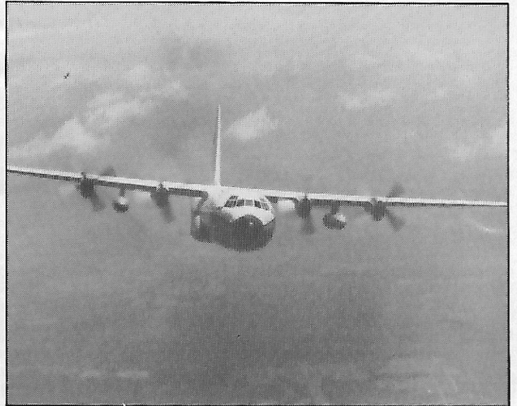
Super Hercules C-130 H-30 Lockheed (USA) algérien

• Le président Chadli Bendjedid a présidé une cérémonie de sortie de deux promotions d'officiers de l'école nationale des ingénieurs et techniciens de Bordj El Bahri , en présence de M.