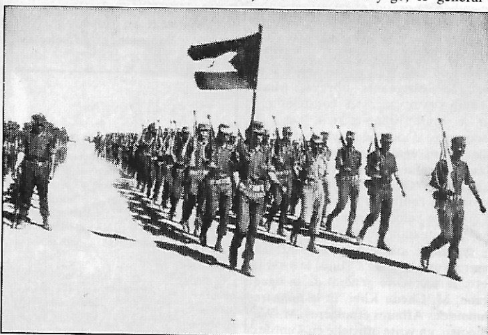
Combattants du front Polisario défilant

Au sujet de la situation militaire au Sahara, un dirigeant du front Polisario a admis l'existence de « certaines difficultés dues à la diminution de la solidarité internationale », qu'il a notamment attribuée à « la politique extérieure des Etats-Unis ».