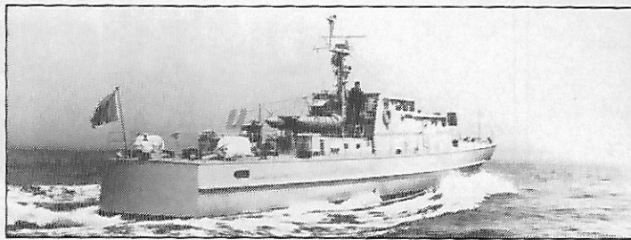
Un des patrouilleurs côtiers de 32 m de la marine royale marocaine. Ceux-ci montent bonne garde en ce qui concerne la pêche

• Les autorités ont fait arraisonner deux chalutiers espagnols, à El-Hoceima, qui opéraient illégalement dans les eaux territoriales de la région. Les motifs retenus contre le Rio Torres et le Palma de Ganda, qui ont leur port d'attache à Malaga, étaient la pêche sans autorisation et l'utilisation de filets non réglementaires.