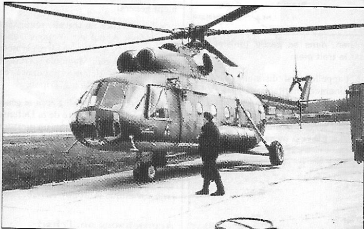
Hélicoptère Mi-8 de fabrication soviétique. Les forces armées algériennes, qui sont dotées d'appareils de ce type, en font changer les batteries par le groupe français SAFT

• Du matériel cinématographique , du matériel photographique, du matériel de vidéo et du matériel de maintenance, ont fait l'objet d'un appel d'offres du ministère de la Défense nationale, direction de la planification et du budget, BP 298, Alger-Gare.