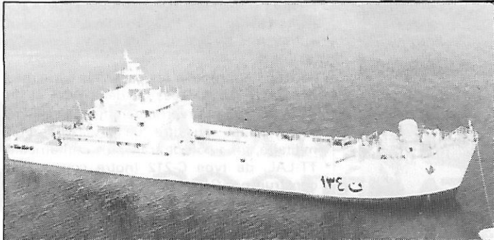
Bâtiment de débarquement de chars libyens Ibn Ouf-132 de type PS-700, construit par CNIM (France)

Les deux bâtiments de débarquement de chars libyens, l'Ibn Ouf-132 et l'Ibn Haritha-134, de type PS-700 livrés par la CNIM (France) respectivement le 11 mars 1977 et le 10 mars 1978, ont fait escale au port de Tanger fin septembre qu'ils ont quitté à destination du port tunisien de La Goulette qu'ils devaient rallier dans les premiers jours d'octobre.