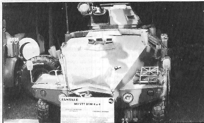
VTT M-3 BTM Panhard (France) avec tourelleau SAMM S-365

• Le bataillon de la garde présidentielle, nouvellement créé, reçoit actuellement ses véhicules blindés 4 x 4 à roues de type M-3 Panhard (France) camouflés, commandés à la fin de l'année 1982 au terme d'un premier contrat. Exposés lors de la neuvième exposition française de matériels d'armement terrestre qui vient de fermer ses portes à Satory, il s'agit de (voir AD n° 55-56) : — 44 M-3 VTT BTM, transports de troupe, équipés d'un tourelleau SAMM S-365 armé d'une mitrailleuse lourde belge FN Browning de 12, 7 mm avec une réserve de 1 000 munitions et d'une mitrailleuse convertible de type français GIAT AA-52 de calibre 7, 62 mm (2 200 munitions) et doté d'une lunette optique et d'un épiscopes de jour Sopelem modèle 623-L. Les radiocommunications du bord sont assurées par un émetteur-récepteur VHF TRC-569 et par un HF BLU TRC-331 de Thomson-CSF (France).