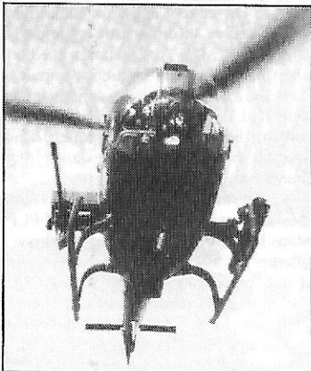
Gazelle Aérospatiale (France) équipée d'un canon M-621 Giat (France) de 20 mm

• A la mi-avril, ont été livrés aux forces armées 12 hélicoptères Gazelle Aérospatiale (France), armés d'un canon M-621 de 20 mm Giat (France).