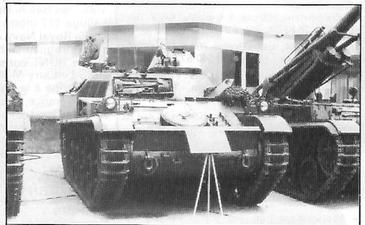
AMX-13 RATAc et AMX-13 F-3, canon automouvant de 155 mm Creusot-Loire (France)

Les FAR reçoivent les derniers matériels d'une commande passée en 1981 par l'Arabie saoudite (contrat Ghazal) auprès de Creusot-Loire (France), matériels destinés à l' équipement de deux nouveaux régiments d'artillerie . Le contrat porte sur la fourniture de 16 canons automouvants AMX-13 F-3 de 155 mm (radiocommunications : un VHF TRC-213 et un TRC-13 de Thomson-CSF par véhicule), de 4 blindés AMX-13, porteurs chacun d'un radar RATAc, et d'un blindé AMX-13 de dépannage (émetteurs-récepteurs : un VHF TRC-570 et un TRC-571 par véhicule). Les derniers véhicules, en cours de livraison, ont été présentés à la neuvième exposition française de matériels d'armement terrestre de Satory qui vient de fermer ses portes. Rappelons que deux régiments avaient été équipés de tels matériels en 1975.