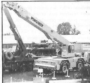
Grue automotrice de 20 tonnes Pinguely (France)

• Le ministère de l'Intérieur, pour la protection civile, vient de recevoir une grue automotrice tout terrain rapide de 20 tonnes de capacité de levage réalisée par Pinguely, filiale de Creusot-Loire (France), qui a été exposée à la neuvième exposition française de matériels d'armement terrestre de Satory qui vient de fermer ses portes.