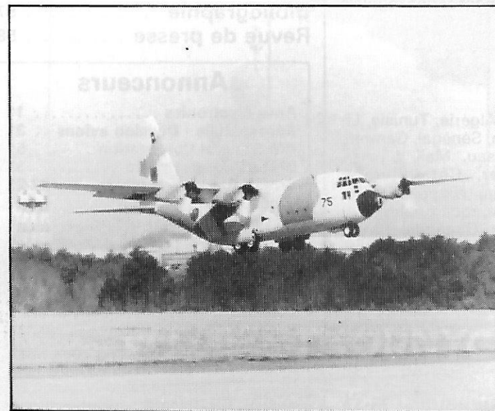
Lockheed C-130-H Hercules (USA) des forces royales air

• Le Premier ministre chinois, M. Zhao Ziyang, a effectué une visite officielle de trois jours . Au cours de son séjour, il a été reçu notamment par le roi Hassan II. Sa visite a permis aux deux pays de constater la grande convergence de leurs positions sur les principaux problèmes internationaux. Sur le Proche Orient, M. Zhao a tenu à dénoncer « la politique d'agression et d'expansion » israélienne et à exprimer le soutien de son pays au plan de paix arabe de Fès. Les huit points de ce plan, « rationnels et réalistes » constituent « une bonne base pour le règlement global et équitable » de ce problème, a-t-il dit. Le Premier ministre chinois s'est en outre déclaré convaincu que les Palestiniens et les autres peuples arabes parviendront, en renforçant leur unité et en persévérant dans le combat, à triompher « en dépit de tous les obstacles et les vicissitudes ».