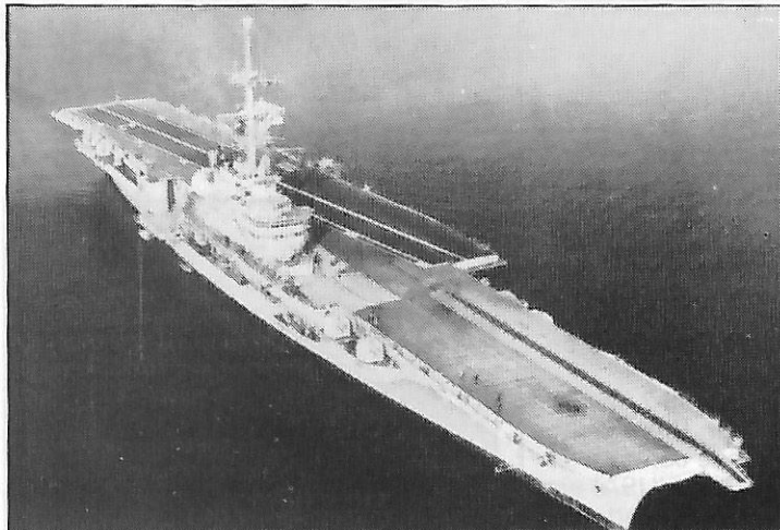
Porte-avions Clémenceau de la marine française

Les manœuvres franco-marocaines du 25 novembre 1982, critiquées par l'officiel quotidien algérien El Moudjahid, sont « des exercices de pratique courante entre marines nationales de pays amis », a déclaré le porte-parole français du quai d'Orsay. En réponse à une question, le porte-parole a précisé que « deux bâtiments de la marine française : le porte-avions Clémenceau et la frégate lance-engins Duquesne, ont procédé, à l'occasion de l'escala à Casablanca, prévue de longue date, à des exercices conjoints avec les forces aéronavales marocaines, les 25 et 26 novembre... » « Ces exercices, qui sont de pratique courante entre marines nationales de pays amis lors des passages ou des escales de navires français, ont consisté en des simulations d'attaques aériennes sur des objectifs terrestres et maritimes et se sont déroulés dans les zones nord et nord-ouest du Maroc » sur la côte atlantique du royaume.