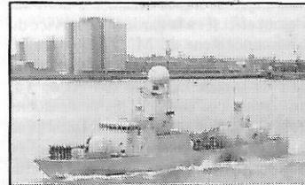
Patrouilleur rapide lance-missiles Ares Badr 678 construit par Vosper Thornycroft (GB)

Le 3 décembre 1982, au cours d'une manœuvre dans le port d'Alexandrie, le cargo français Charles Schiaffino a touché durement le patrouilleur rapide lance-missiles Ares Badr 678 (ex-566) classe Ramadan Vosper Thornycroft (GB) qui était à quai.