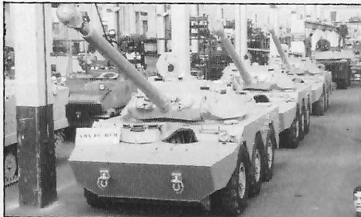
Engins blindés de reconnaissance et de combat AMX-10 RCM de GIAT (France) destinés aux Forces armées marocaines, en attente de livraison à l'usine de Roanne

● A la suite de difficultés financières, les FAR n'avaient pu recevoir que deux engins blindés de combat et de reconnaissance 6x6 type GIAT AMX-10 RCM sur 106 commandés en 1978. Ces premiers matériels, livrés en 1980, qui ont servi à la formation des équipages, devraient être complétés par de nouvelles unités, le passif financier étant en voie de solution avec le gouvernement français. Dix exemplaires sont prêts à être livrés.