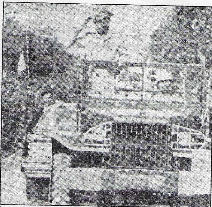
Le roi Hassan II passe en revue les troupes à l'occasion du 21 e anniversaire de son intronisation.

A la princesse Lalla Meriem, nommée à la tête des services des œuvres sociales des Forces armées royales, le souverain a dit, dans une allocution, que cette nomination était un honneur, car celui qui œuvre pour les forces armées royales est honoré, mais qu'elle était aussi une charge, car elle constitue une lourde responsabilité spirituelle et humaniste.