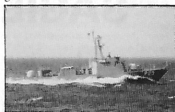
Patrouilleur rapide type PR 72 de SFCN (France)

Le patrouilleur rapide type PR 72 MS Njambuur (numéro de chantier 773) vient d'être livré à la marine sénégalaise par les chantiers navals français SFCN de Villeneuve-la-Garenne (France). Mis sur cale en mai 1980 et lancé le 23 décembre 1980, il a été achevé en septembre dernier. Capable d'assurer des missions d'interception en haute mer et des missions de surveillance loin de toute base militaire, il sera livré à la marine sénégalaise après la mise en place du système d'armes par la DCAN/DTCN de Lorient. Le Njambuur mesure 58,70 m de longueur hors tout (54 m entre les perpendiculaires), 8,22 m de largeur hors membres (7,60 m de largeur à la flottaison), 4,78 m de creux au maître couple, 2,06 m de profondeur de carène et 2,18 m de tirant d'eau milieu. Avec les munitions, le déplacement léger est de 381 tonnes (déplacement moyen 416 t ; déplacement en charge 451 t). L'appareil propulsif, constitué de 4 moteurs Diesel AGO type 195 V 16 RVR entraînant 4 lignes d'arbres indépendantes avec 4 hélices à pales fixes (in-viseur-réducteur Citroën Messian), donne une puissance continue à 100 % de 12 800 ch (4 x 3 200 ch). Au déplacement de 410 tonnes et à la puissance continue des moteurs, la vitesse maximale est de 30 nœuds et la distance franchissable de 2 500 milles nautiques à 16 nœuds. L'armement comprend quant à lui, 2 canons de 76 mm Oto Melara et 2 canons de 20 mm type F.2. L'équipage est de trente-neuf hommes et sept passagers.