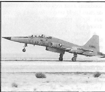
Avion de combat F-5F biplace Northrop (USA)

• Le département de la Défense US a indiqué au Congrès américain qu'il souhaitait vendre à la Tunisie quatre avions de combat F-5F Northrop. Le marché, qui comprend des pièces de rechange, l'assistance technique et la formation, porte sur près de 65 millions de $.