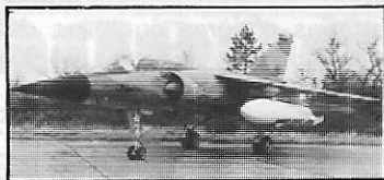
Mirage F1 marocain

Les autorités ont attiré l'attention de l'ensemble de l'opinion publique sur l'agression dont le Maroc a été victime le 13 octobre 1981. En effet, une attaque d'une grande violence mettant en jeu un arsenal militaire des plus sophistiqués eut lieu dans le Sahara marocain, et plus précisément à Guelat-Zemmour. Au cours de cette attaque ont été utilisés des SAM 6 et peut-être même des SAM 8 dont les rampes de lancement furent détectées par l'aviation marocaine, comme furent repérés des dizaines de blindés à chenilles. Les missiles ont abattu un avion C 130 Hercules volant à 18 000 pieds et même un mirage F1 volant à une altitude de 30 000 pieds et à sa vitesse maxima. Selon les autorités, l'usage efficace d'un tel matériel requiert des techniciens de très haut niveau qu'aucun Etat de la région ne compte parmi ses nationaux. De plus, ces missiles nécessitent un support logistique tel qu'ils n'ont pu être utilisés qu'à partir de territoires de pays voisins du Maroc.