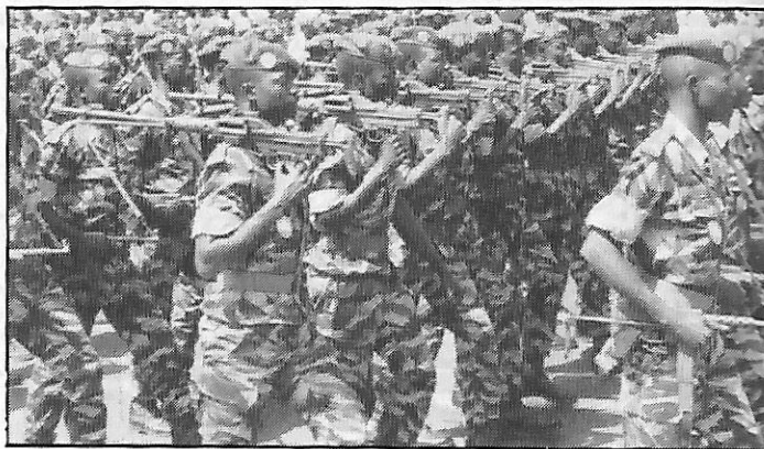
Défilé de l'armée sénégalaise durant la fête nationale

• Immobilisé pendant 2 mois au sud de l'île de Gorée à la suite d'une avarie dans la coque, le « Texaco Great Britain », pétrolier de 345 m de long en cours de réparation par « Dakar Marine », est le plus grand navire ayant jamais franchi les jetées du port sénégalais.