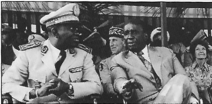
Le ministre de la Défense, Clédor Sall, en compagnie du général de division Idrissa Fall, chef d'état-major général des armées