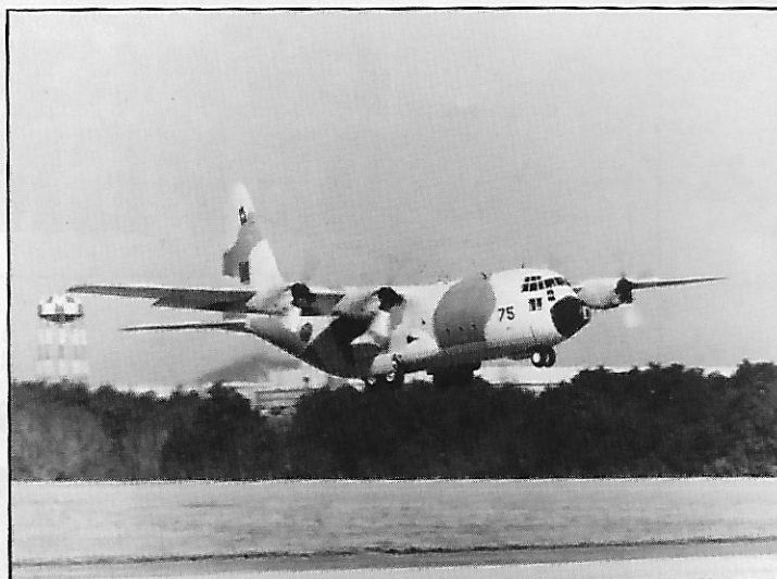
Lockheed Hercules C 130H des forces aériennes royales

La Chambre Marocaine des Représentants a adopté une motion dénonçant « les agissements politiques et militaires ainsi que la propagande du colonel Kadhafi visant à porter atteinte à l'unité des peuples arabes et islamiques ». Le Parlement a lancé une mise en garde « contre le danger que représente la politique de Kadhafi qui ne peut servir que les intérêts des ennemis de la nation arabe et islamique ».