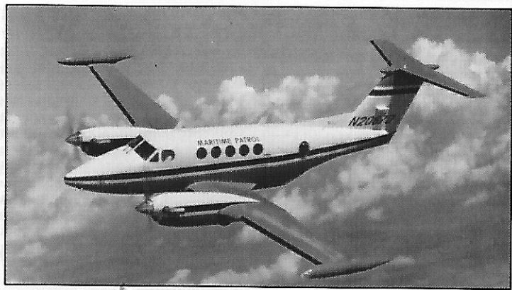
Maritime Patrol Super King Air 200 T Beechcraft

Le colonel Hachemi Hadjerès, membre du Comité central et chef de la 5 e Région militaire est arrivé à Sétif où il a présidé au centre d'instruction d'Ain-Arnat, la sortie d'une promotion de sous-officiers de l'ANP. Au cours de cette cérémonie, le colonel Hadjerès est intervenu pour féliciter les composantes de cette 27 e promotion baptisée « Reconstruction d'El-Asnam » pour les efforts méritoires durant la formation.