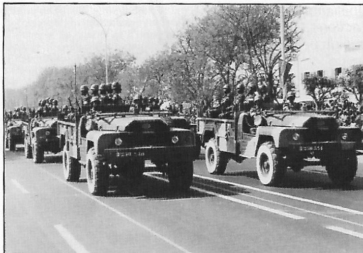
Défilé des troupes sur VLRA-ACMAT

Depuis le 10 novembre et jusqu'au 12 décembre 1980, les Forces armées procèdent au recrutement annuel d'appelés volontaires pour effectuer la durée du service légal, fixée à 24 mois. L'incorporation se fera en trois fractions, les 2 janvier 1981, 2 mai 1981 et 1er septembre 1981.