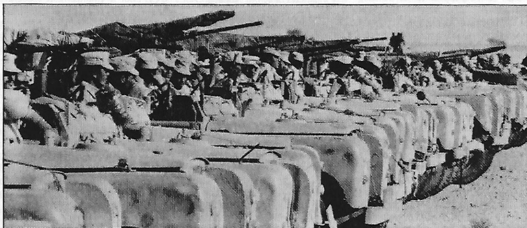
Soldats du Polisario

● M. Ahmed Ben Bella va recouvrer une totale liberté de mouvement sur l'ensemble du territoire algérien.