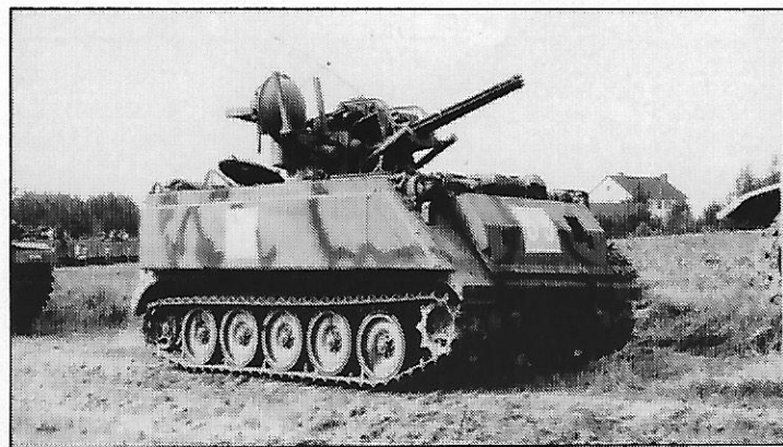
M 113 équipé de systèmes d'armes antiaériens U.S. Vulcan.

● Les Forces armées royales ont reçu récemment des matériels de visée longue distance NOD de chez PPE (GB), système de grande portée pour la direction de tir d'artillerie, muni d'un oculaire à vision binoculaire permettant à l'opérateur de voir avec les deux yeux simultanément l'objectif (grossissement \times 5 ).