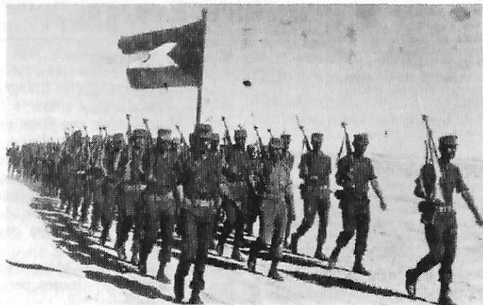
Défilé des troupes sahraouis.

Selon le communiqué, une unité de l'armée de l'ALPS a pilonné durant ces deux jours, à l'arme lourde, la garnison marocaine de Bir-Enzaran « dont un poste de garde a été totalement détruit ». Les tirs Sahraouis « ont atteint le poste de commandement » des troupes marocaines « dont les installations ont été mises hors d'usage ».