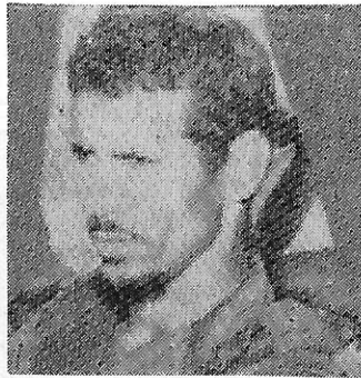
Le nouveau ministre de la défense nationale, le lieutenant-colonel Khouna Ould Heydalla.

Le nouveau gouvernement, dirigé par le lieutenant-colonel Ahmed Ould Bouceif, se compose de 16 membres au lieu de 18, mais ne comprend aucun changement notable par rapport à l'ancien cabinet. On enregistre toutefois l'entrée du lieutenant-colonel Khouna Ould Heydalla à la Défense nationale et celle du lieutenant-colonel Abdelkader, nommé ministre chargé de la permanence du comité militaire de Salut national, ainsi que le départ de M. Cheikhna Ould Mohamed Laghdaf, ancien ministre d'Etat à la présidence.